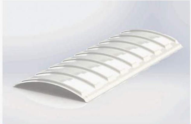
DOMO SEM DUPLA SAÍDA DE AR