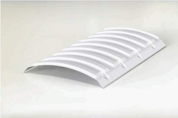
DOMO CONVENCIONAL COM DUPLA SAÍDA DE AR